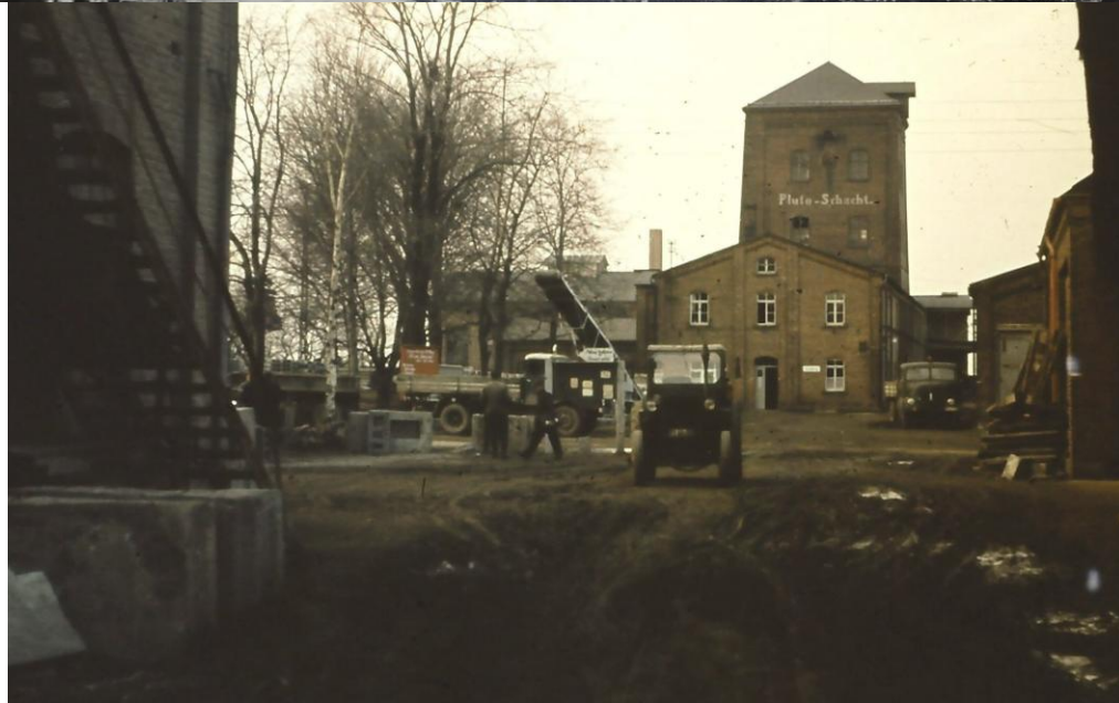
Pluto- und Merkurschachtanlagen ca. 1930 / 1960