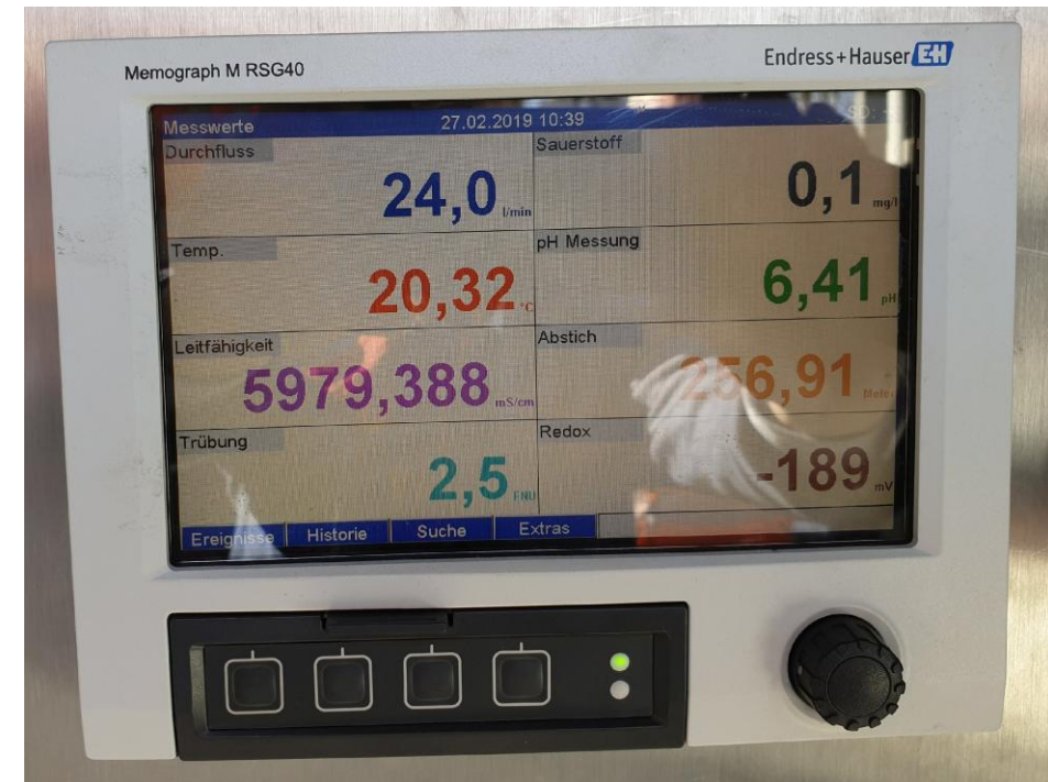
Foto Grubenwassermessstelle auf dem ehemaligen Gelände der Kaisergrube II ; Pumpversuch 2019