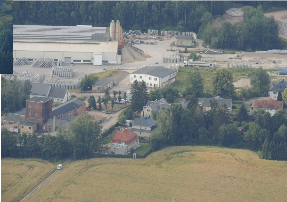
Pluto- Merkurschachtanlagen 2021