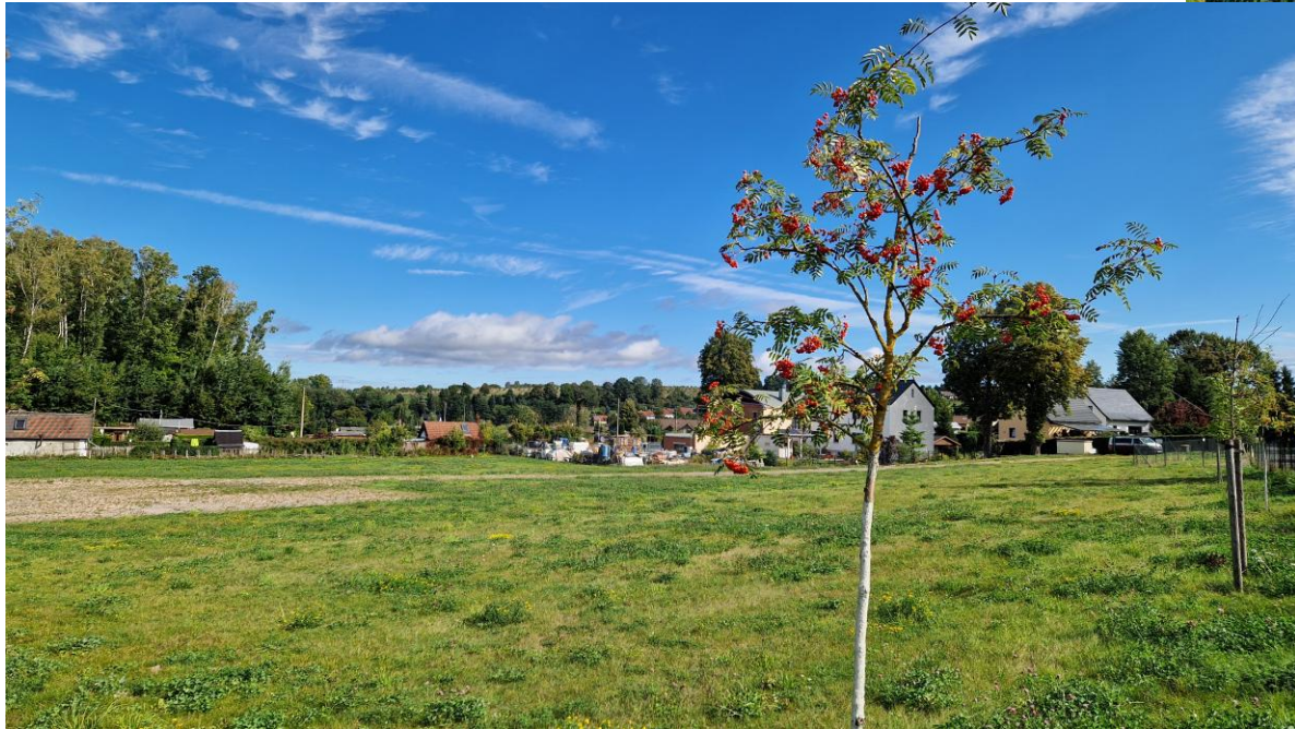
Kaisergrubenschacht II im September 2025