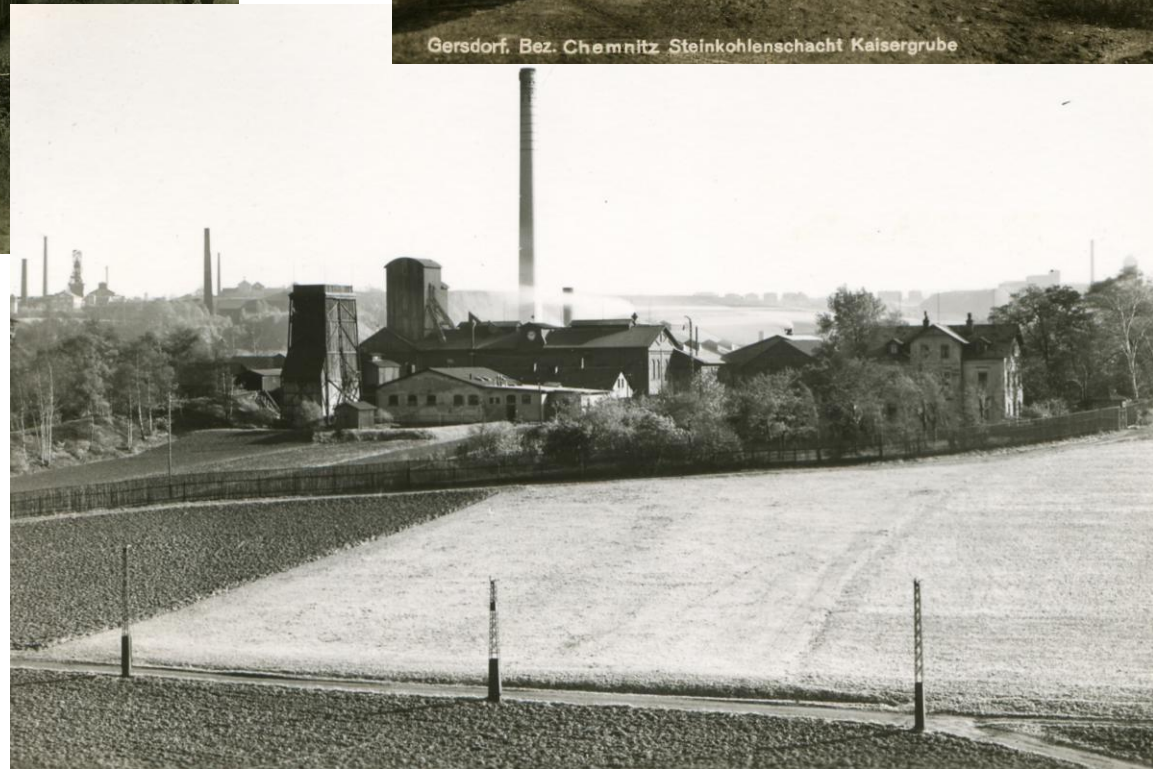
Abbildungen der Kaisergrubenschächte von 1910 - 1929